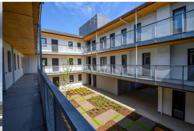
PATIO INTERIOR AJARDINADO